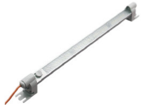
Ausführung mit Ein-/Aus-Schalter