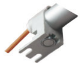
Ausführung mit Magnetbefestigung